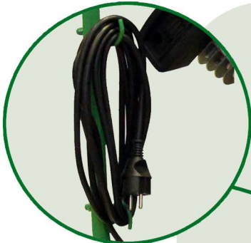
5 m Anschlusskabel mit Halter