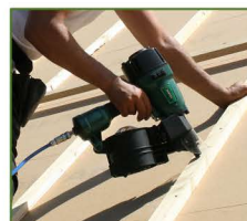
100 % Druckluftversorgung für Coilnagler bis 90 mm