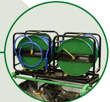
Halterung für 2 PREBENA Druckluft- Schlauchtrommeln