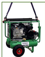
Für Kranfahrten geeignet

Motor: 230 V / 2200 W Drehzahl: 11800 U/min. Ansaugleistung: 460 l/min. Füllleistung: 300 l/min. max. Druck: 10 bar Kessel: 23 l Gewicht: 74,6 kg Abmessungen: L 850 x B 650 x H 735